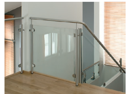
Treppen und Treppengeländer