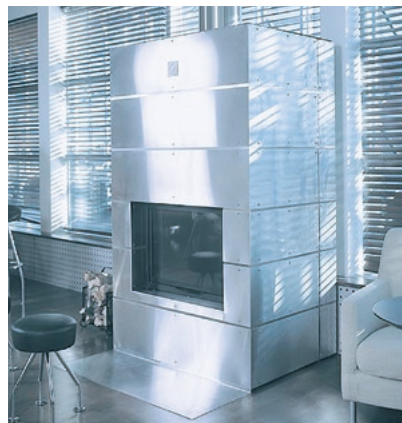
Plattenbeschichtungen von Feuerstellen