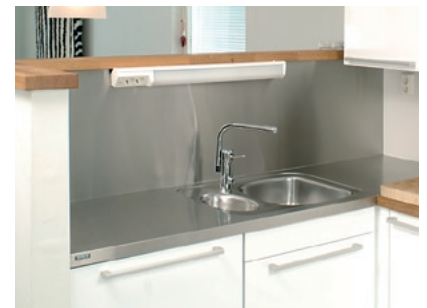
RST-Plattenbeschichtungen zwischen Kücheneinrichtungen

Betamet Oy B&A Design Sälpätie 4, 90630 Oulu Finnland Telefon +358 207 551 700 Fax +358 207 551 708 betamet@betamet.fi, www.betamet.fi